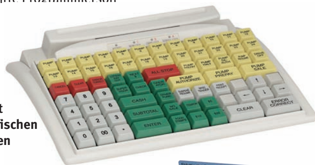
MC 84 WX mit kundenspezifischen farbigen Tasten