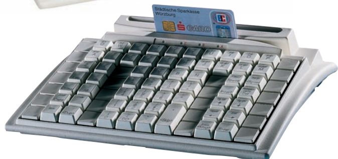
MC 84 WX mit MSR