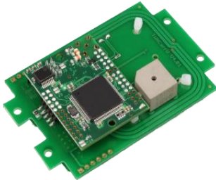
TWN4 OEM PCB Untenansicht