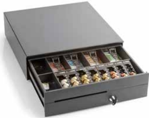
HS 408 mit 8500 RE

Austausch des Originaleinsatzes gegen INKiESS MiNiKORD 8500 RE 8 Münzbehälter von 2 € bis 1 C.