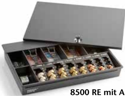
8500 RE mit Artdev Deckel*