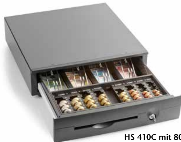
HS 410C mit 8001 RE

Austausch des Muldeneinsatzes gegen INKiESS MiNiKORD 8001 RE 8 Münzbehälter von 2 € bis 1 C.