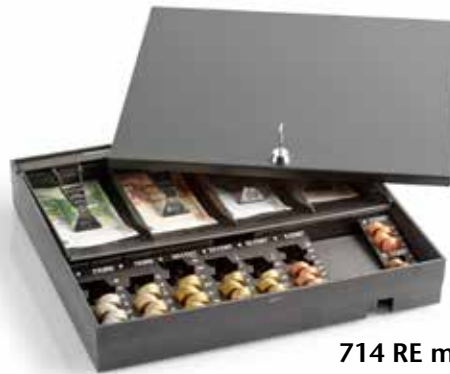
714 RE mit Deckel

Austausch des Originaleinsatzes gegen INKiESS MiNiKORD 714 RE 7 Münzbehälter von 2 € bis 2 + 1 C.